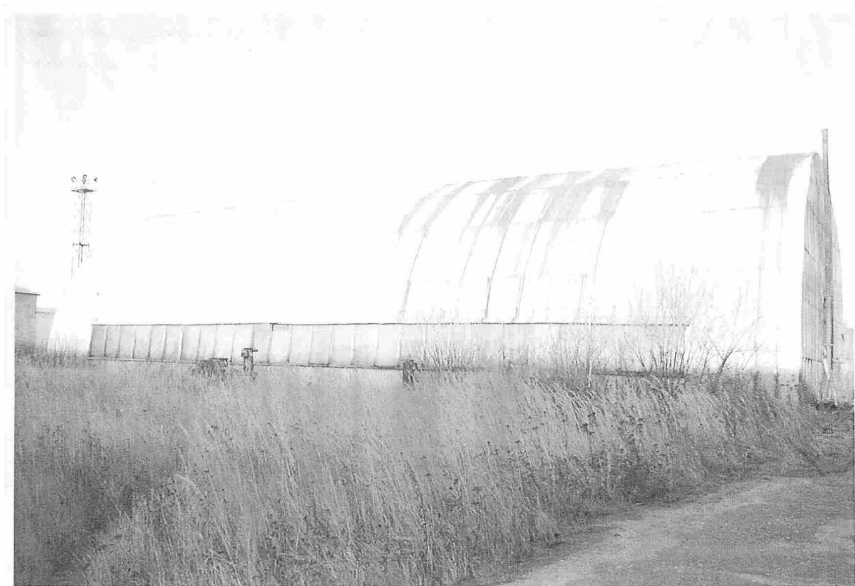
Ангар падающих молотов