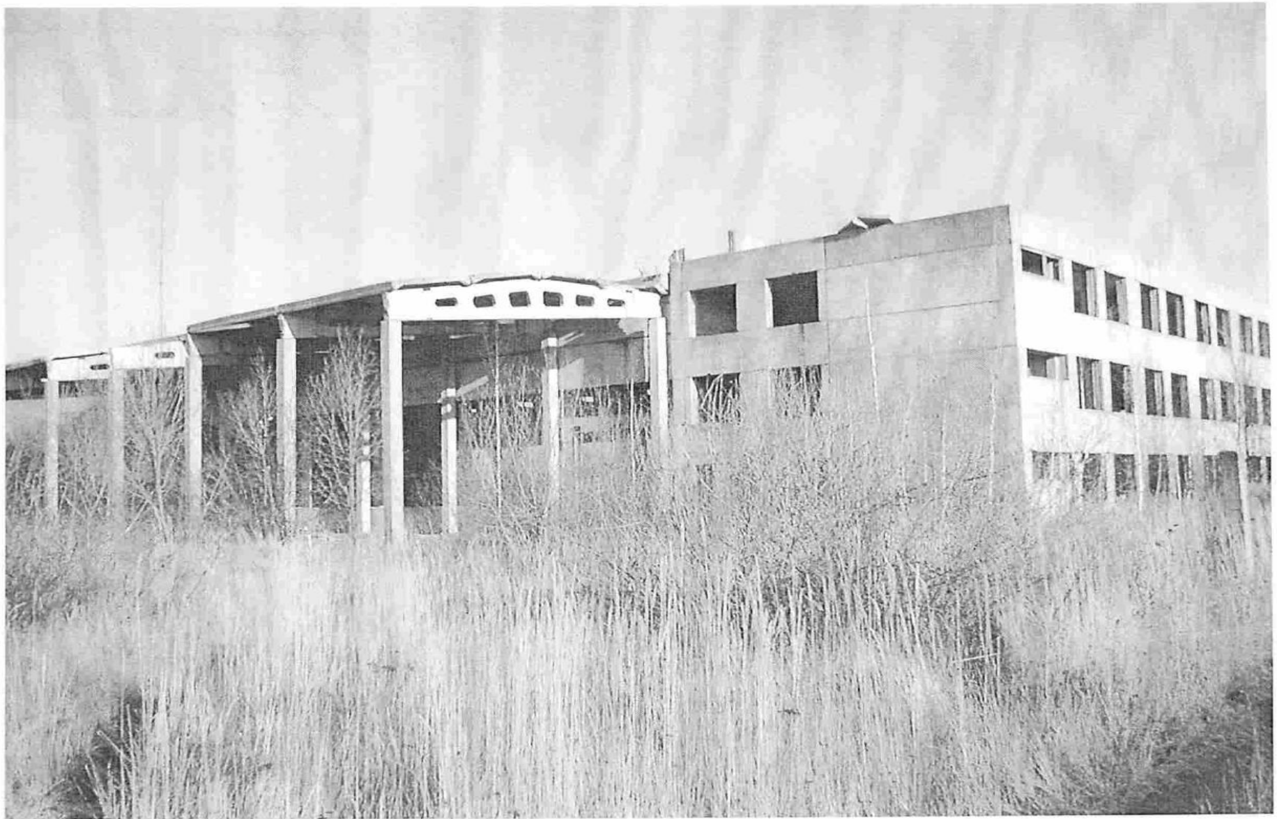
Незавершенное строительством здание № 64 ЛТП